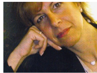
Coralis, l'anno del rinnovamento