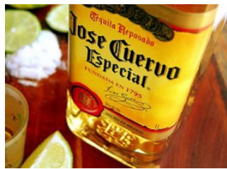
Gancia distribuisce la tequila Jose Cuervo